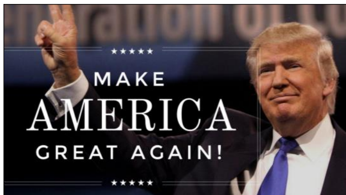
Il presidente americano Donald Trump

vo presidente perché il suo servizio possa essere fruttuoso, assicurando anche "la nostra preghiera che lo illumini e lo sostenga anche nel servizio del benessere e della pace nel mondo". La Cina vuole mantenere relazioni bilaterali "solide e stabili" con il nuovo presidente degli Stati Uniti e i legami