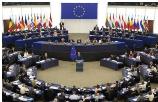
Emiciclo dell'Europarlamento di Strasburgo

Il Parlamento europeo riunito a Strasburgo ha approvato, il 24 novembre, una risoluzione con la quale chiede all'Esecutivo di Bruxelles e agli Stati membri di avviare un temporaneo congelamento dei negoziati in corso con Ankara per l'adesione all'Ue, alla luce delle purghe e delle diffuse violazioni delle libertà fondamentali correlate al fallito golpe del 15 luglio. La risoluzione, sostenuta dai principali gruppi parlamentari (conservatori, socialisti, liberali e Verdi) ha ottenuto 479 voti a favore, 37 contrari e 107 astensioni. Il presidente turco Erdogan ha già liquidato la risoluzione come "priva di valore", accusando l'Ue di voler dare "lezioni di diritti umani, mentre non sa proteggere i bambini che cercano rifugio in Europa". Nella risoluzione si legge che "le misure repressive adottate dal governo turco nell'ambito dello stato di emergenza sono sproporzionate, attentano ai diritti e alle libertà fondamentali riconosciuti dalla Costituzione turca e vio-