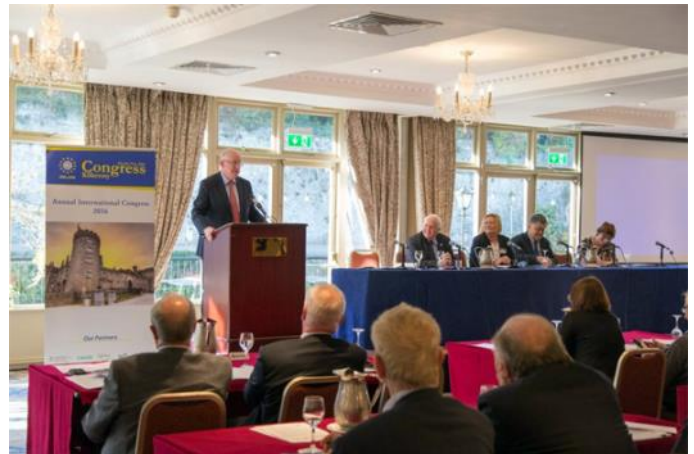
Un momento dei lavori congressuali